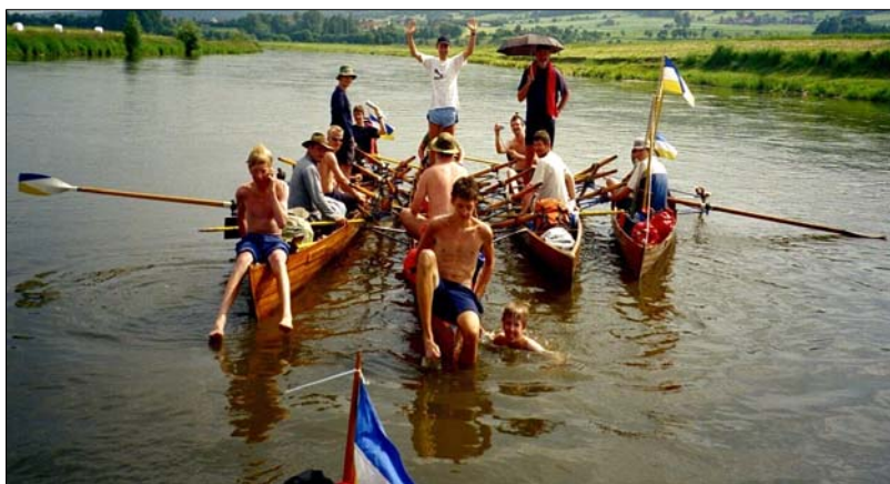
Die Pfingstfahrt zwischen Fuhlen und Rinteln