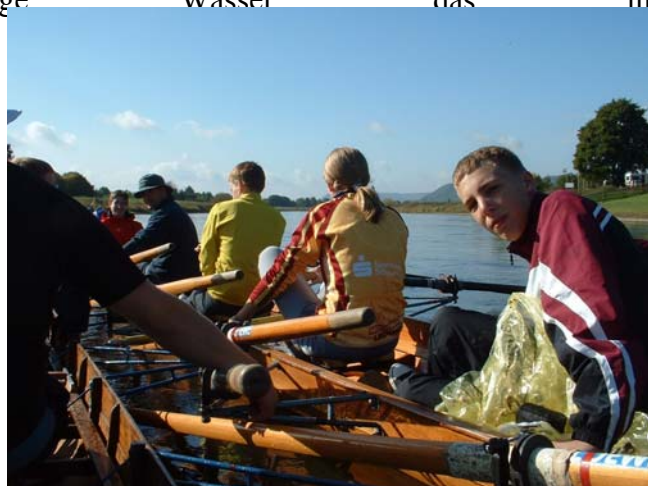
Die Gig-Doppelvierer auf der Weser